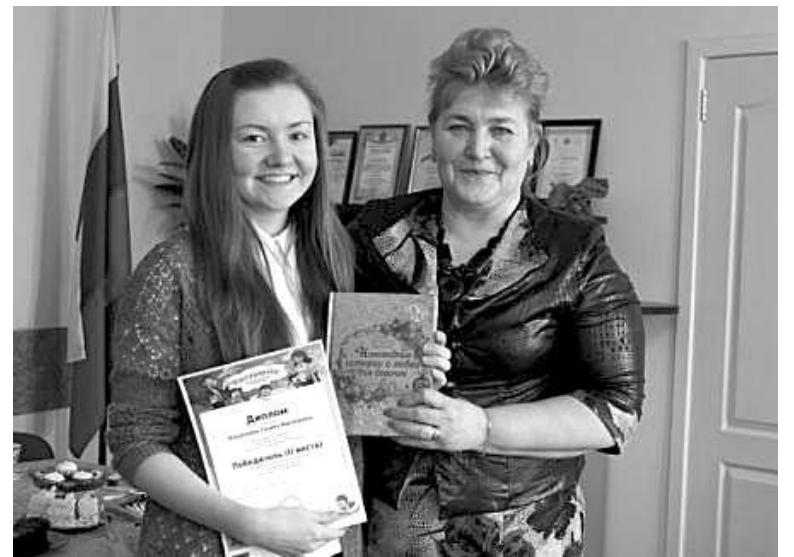
молодежных проектах, предстоя-

За традиционным сладким столом продолжился разговор о проблемах сельских территорий, творческих планах ребят,