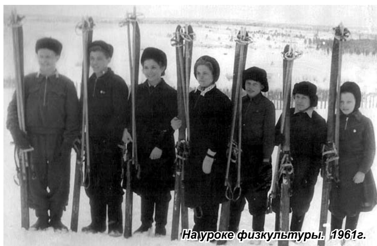
На уроке физкультуры. 1961 г.