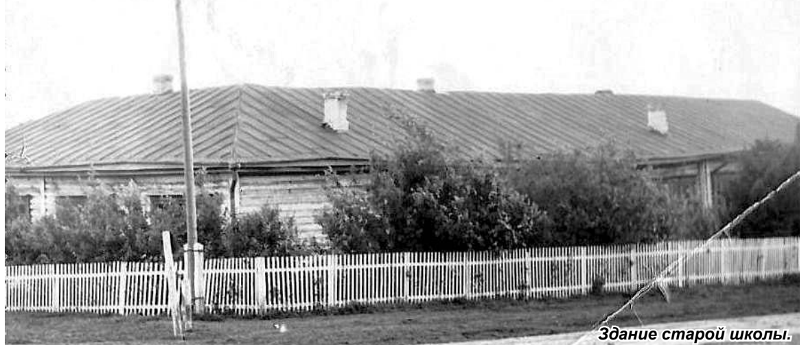
Здание старой школы.