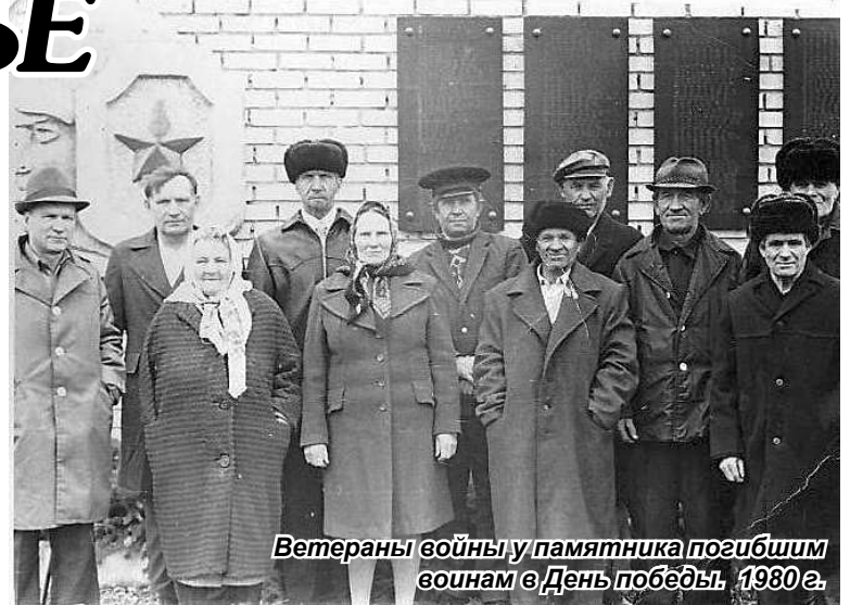
Ветераны войны у памятника погибшим воинам в День победы. 1980 г.

В 1958 не совсем обдуманно, скоропалительно ликвидировали МТС. Большинство колхозов еще были экономически слабы, убыточны, в первую очередь, по причине низких цен на сельскохозяйственную продукцию. Да и техника, особенно трактора, были малопродуктивны, и их было мало. В животноводстве вообще преобладал ручной труд. Опять, как и войну, с раннего утра до ночи, «пластались» здесь вдовы да подростки девочки после школы - семилетки. А затем началась реорганизация - перевод колхозов в совхозы. В 1962 году колхозы Ястребовского и Ново-Ильинского сельсоветов (Ястребово, Барбановка, Ладановка, Ново - Ильинка, Плотбище) вошли в состав племсовхоза.