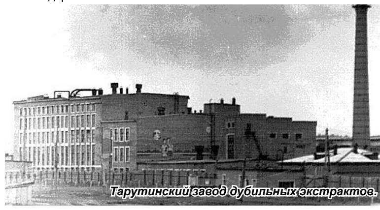
Тарутинский завод дубильных экстрактов.

Совет школьного музея «Память» благодарит за оказанную помощь в сборе материала работников модельной сельской библиотеки п. Тарутино.