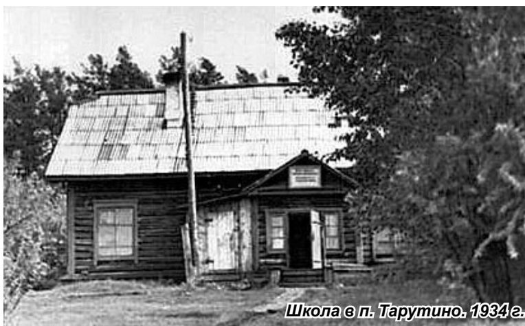
Школа в п. Тарутино, 1934 г.

Партизанские отряды активно помогали красногвардейцам. Братская могила 22 партизан, расстрелянных колчаковцами