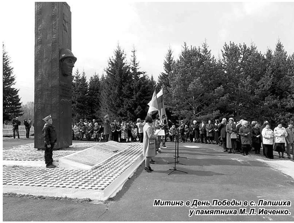
Митинг в День Победы в с. Лапшиха у памятника М. Л. Ивченко.