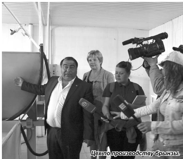
Цех по производству брынзы.