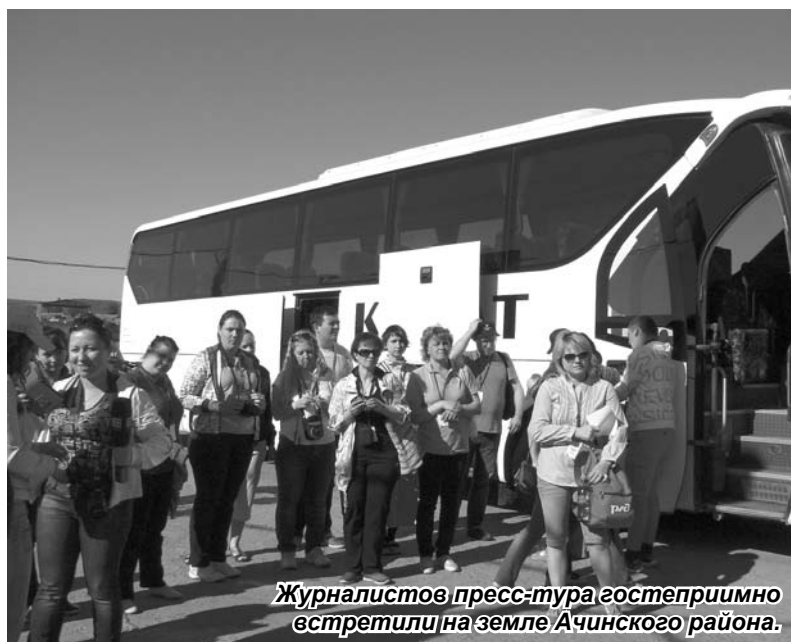
Журналистов пресс-тура гостеприимно встретили на земле Ачинского района.