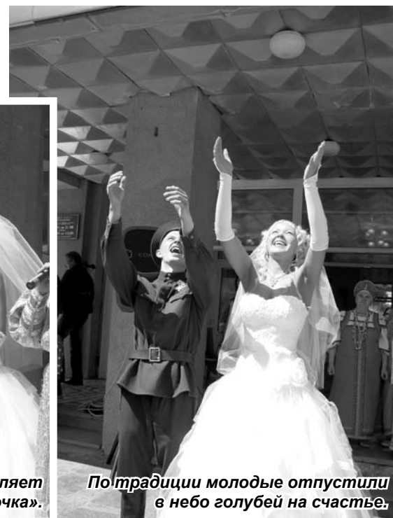
По традиции молодые отпустили в небо голубей на счастье.