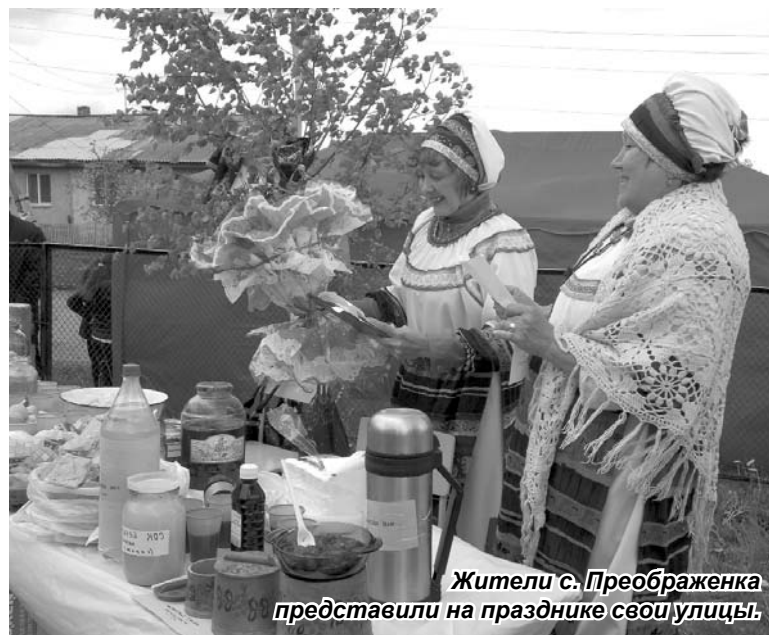
Жители с. Преображенка представили на празднике свои улицы.