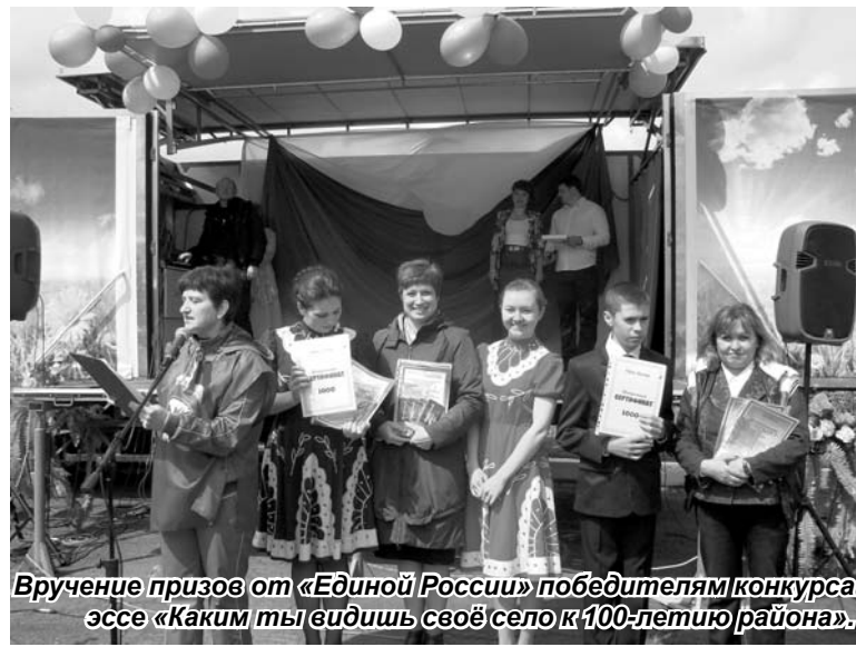
Вручение призов от «Единой России» победителям конкурса эссе «Каким ты видишь своё село к 100-летию района».