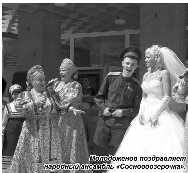
Молодоженов поздравляет народный ансамбль «Сосновоозерочка».