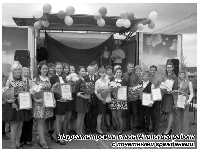
Лауреаты премии Главы Ачинского района с почетными гражданами.