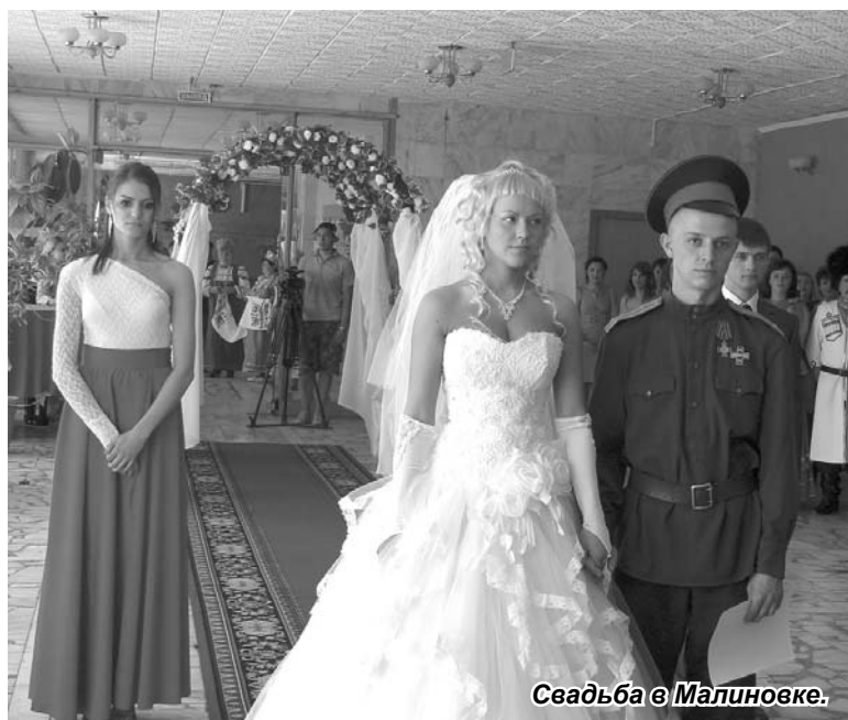
Свадьба в Малиновке.