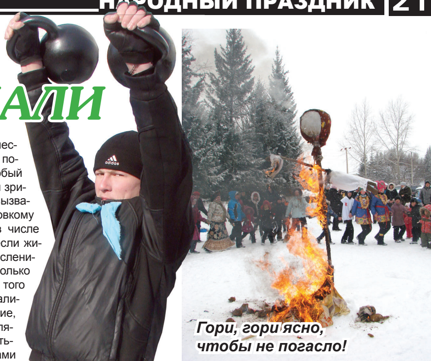
Гори, гори, ясно, чтобы не погасло!

В этот же день масленичные гуляния прошли и у жителей села Преображенка. Для развлечения были предложены перетягивание каната, бег в мешках, конкурс частушек и другие. Самыми активными участниками конкурсов были дети. Праздник закончился дискотеккой.