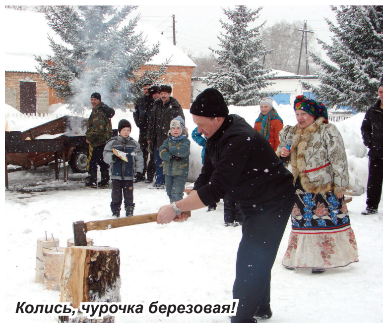
Колись, чурочка березовая!