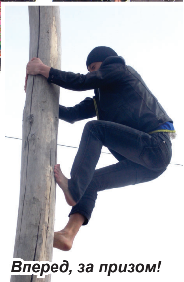
Вперед, за призом!