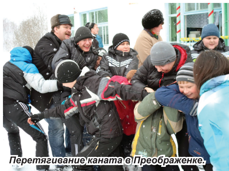
Перетягивание каната в Преображенке.