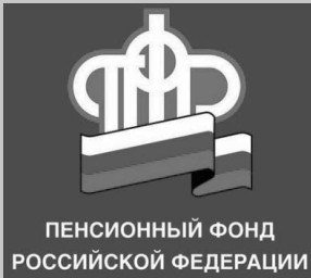
ПЕНСИОННЫЙ ФОНД РОССИЙСКОЙ ФЕДЕРАЦИИ

С 01 января 2010г вступил в действие Федеральный закон от 24.07.2009г № 212-ФЗ «О страховых взносах в Пенсионный фонд Российской Федерации, Фонд социального страхования Российской Федерации и Федеральный фонд обязательного медицинского страхования Российской Федерации».