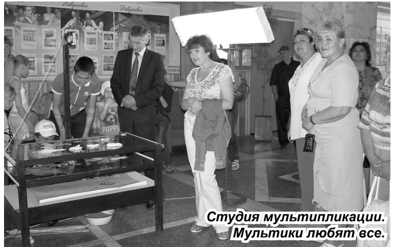
Студия мультимедиа. Мультимики любят все.