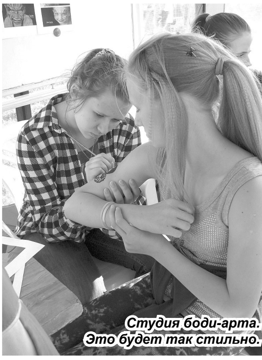
Студия боди-арта. Это будет так стильно.