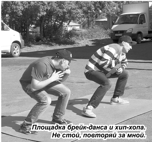
Площадка брейк-данса и хип-хопа. Не стой, повторяй за мной.