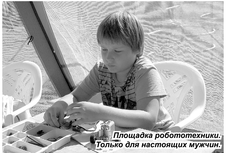
Площадка робототехники. Только для настоящих мужчин.