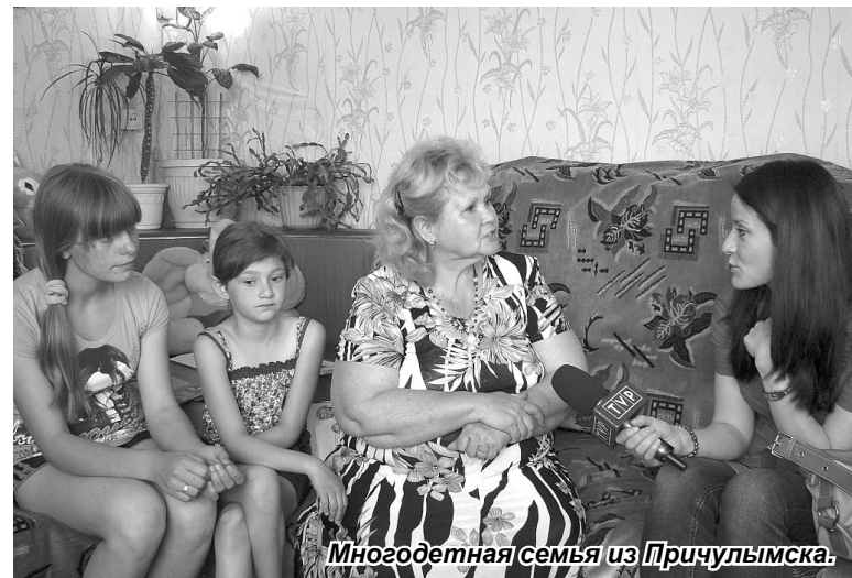
Многодетная семья из Причулымска.