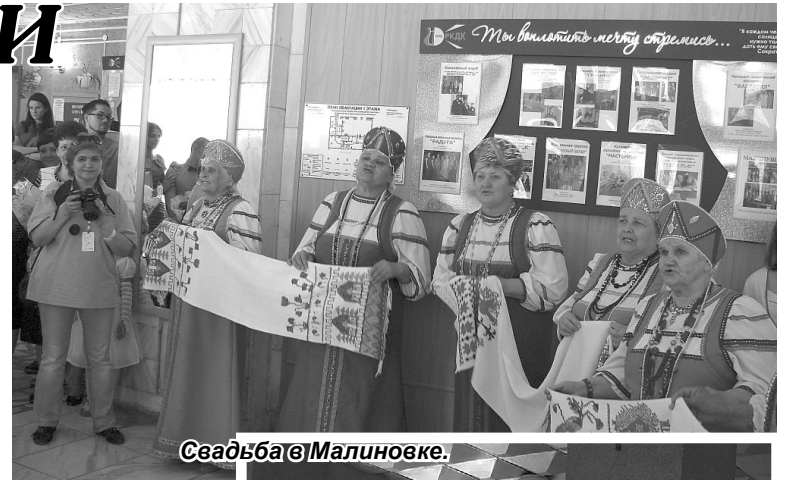
Свадьба в Малиновке.