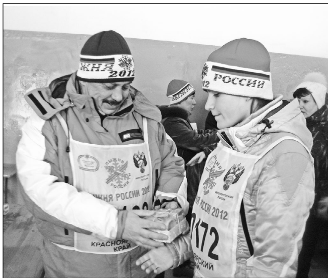
Награждение победителей и снимок на память.