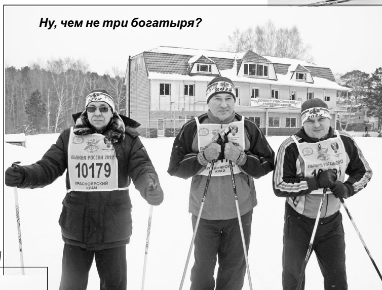
Ну, чем не три богатыря?