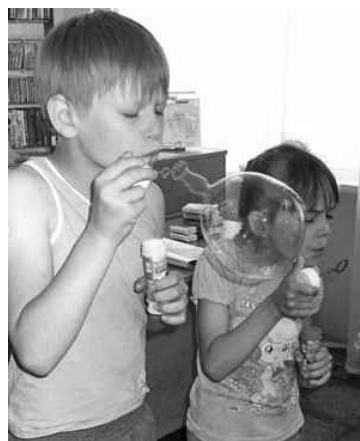
И в шашки играли, и пузыри пускали...