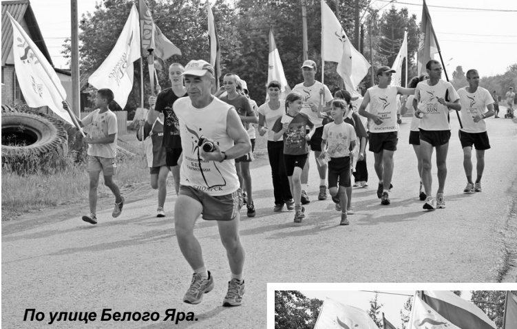
По улице Белого Яра.