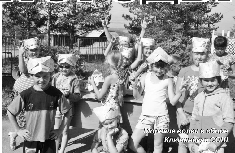
Морские волки в сборе. Ключинская СОШ.