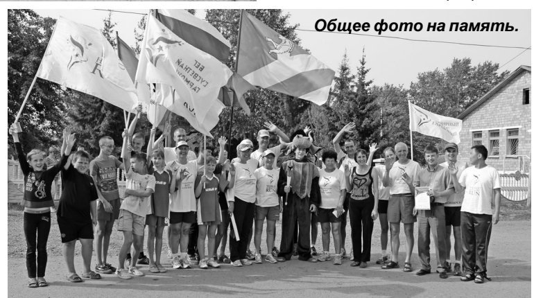
Общее фото на память.

тель, многогранная творческая личность, спортсмен и пропагандист здорового образа жизни. С момента создания эстафеты в ней приняли участие более пяти миллионов человек. Факел побывал в 140 странах - в Европе, Азии, Северной и Южной Америке, Африке и Австралии. Люди из различных сфер деятельности, представители многих народов приняли участие в единой глобальной программе.