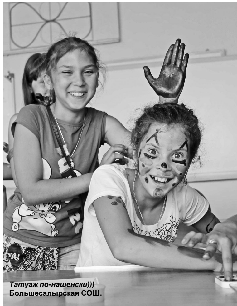
Татуаж по-нашенски))) Большесальерская СОШ.

Внезапное появление Домовенка Кузи в летнем лагере Ключинской школы заинтриговало ребят. Как оказалось, Кузя отстал