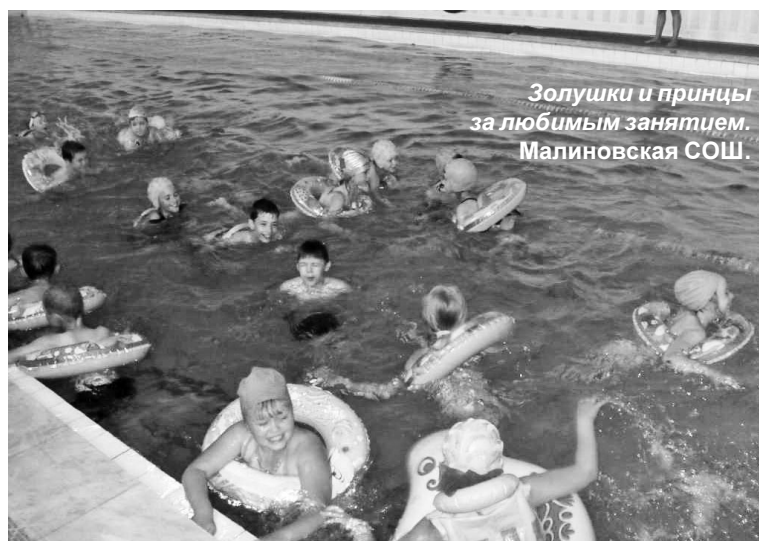
Золушки и принцы за любимым занятием. Малиновская СОШ.