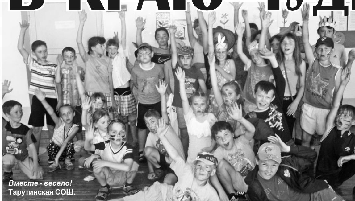
Вместе - весело! Тарутинская СОШ.