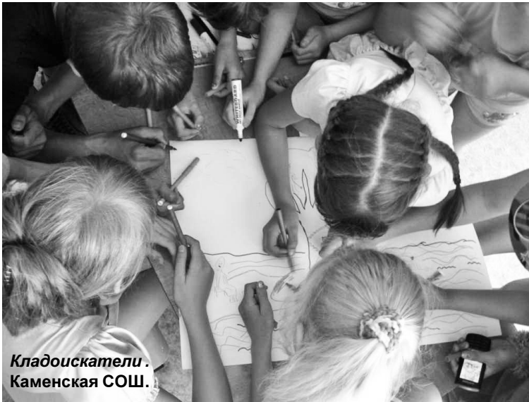
Кладискатели. Каменская СОШ.