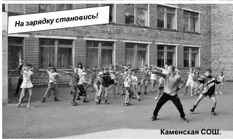
На зарядку становись!