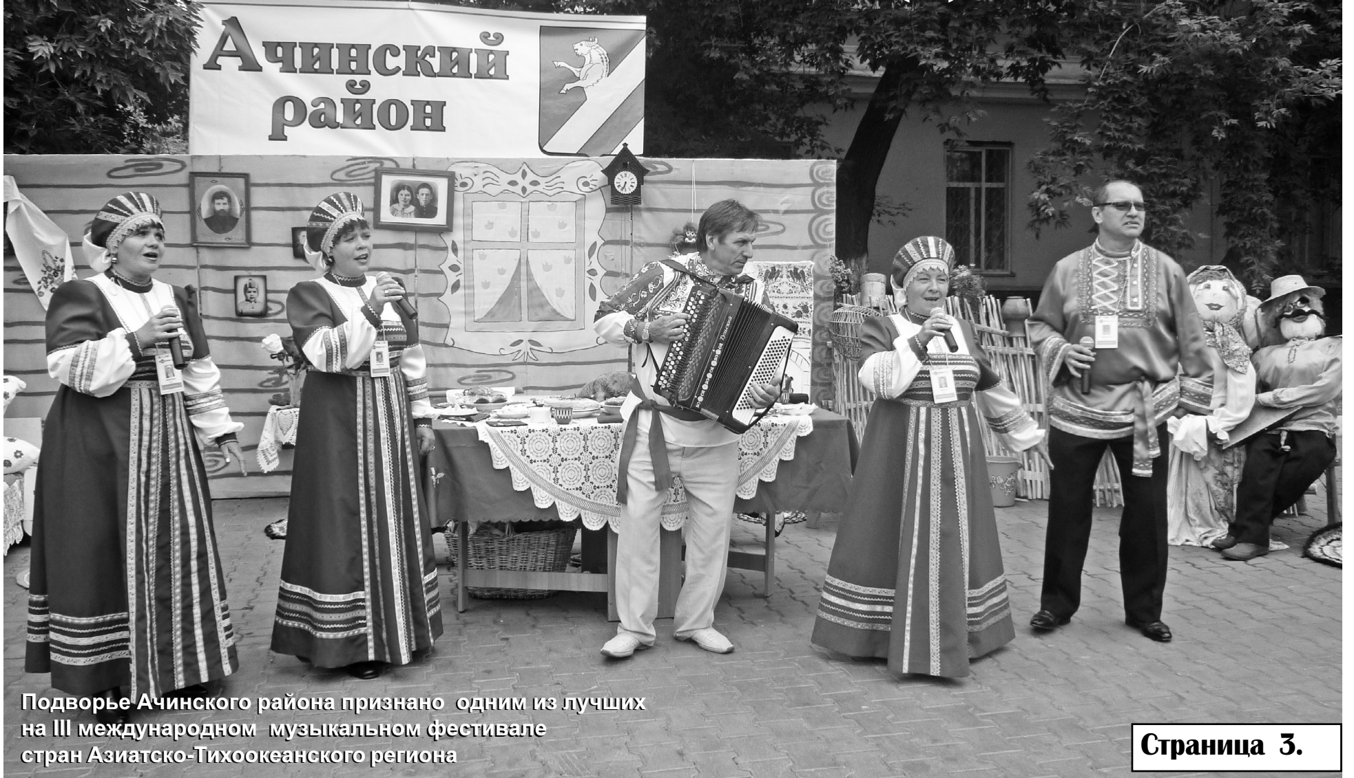
Подворье Ачинского района признано одним из лучших на III международном музыкальном фестивале стран Азиатско-Тихоокеанского региона