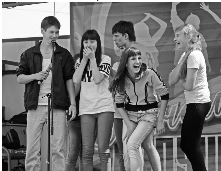
«Только свои» жели не по-детски. Одно слово - КаВээНцики!