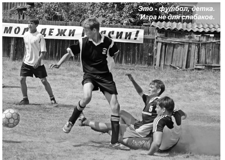
Это - футбол, детка. Игра не для слабаков.