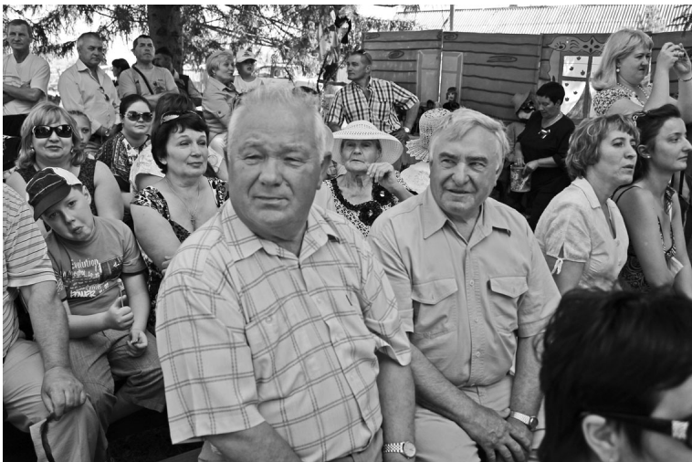
Среди многочисленных гостей праздника - почетные граждане Ачинского района.