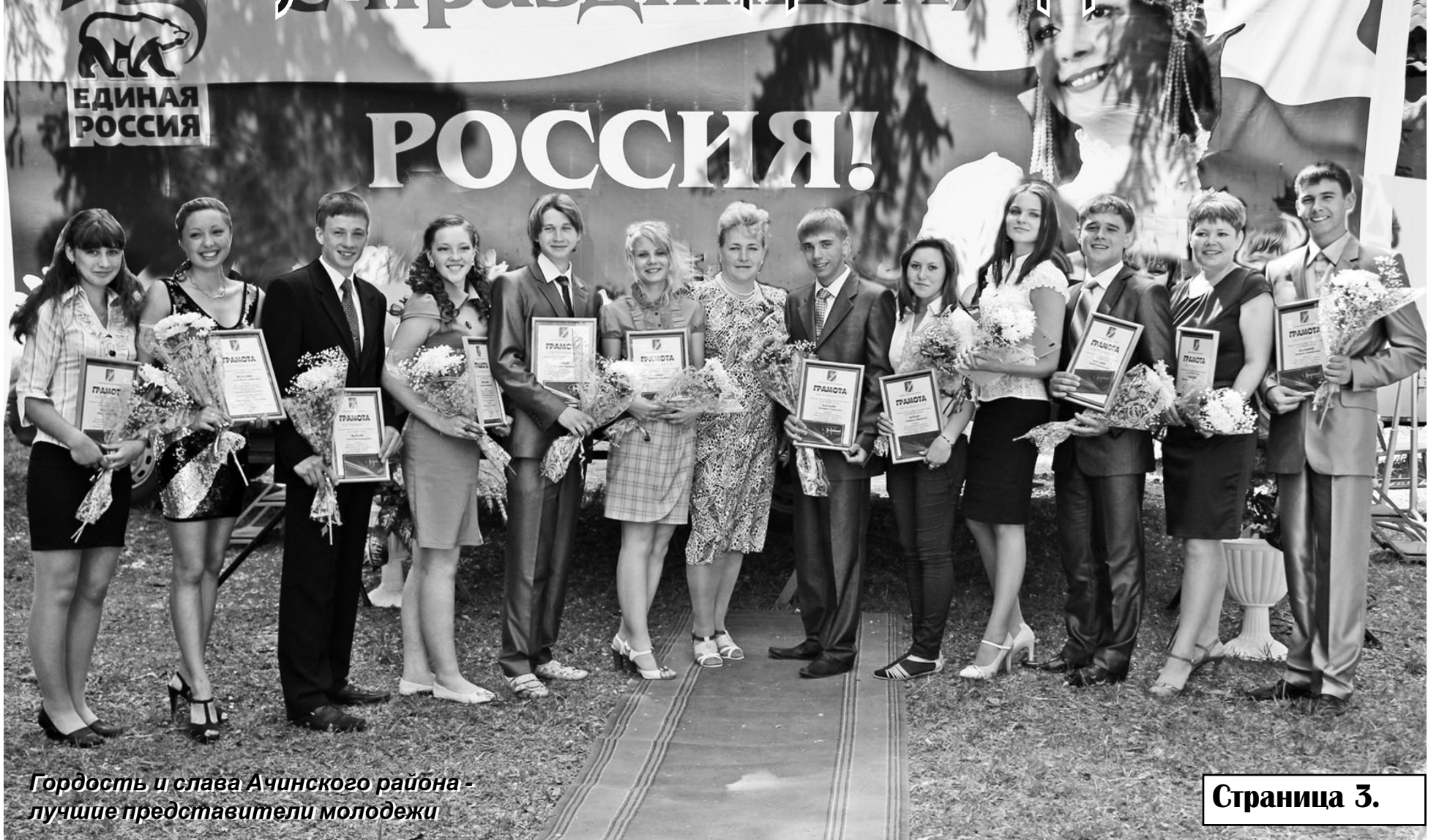
Гордость и слава Ачинского района - лучшие представители молодежи