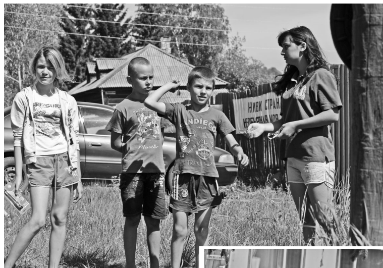
Больше всех радовались празднику самые юные граждане района: помимо всевозможных игр и конкурсов были и сладкие призы.