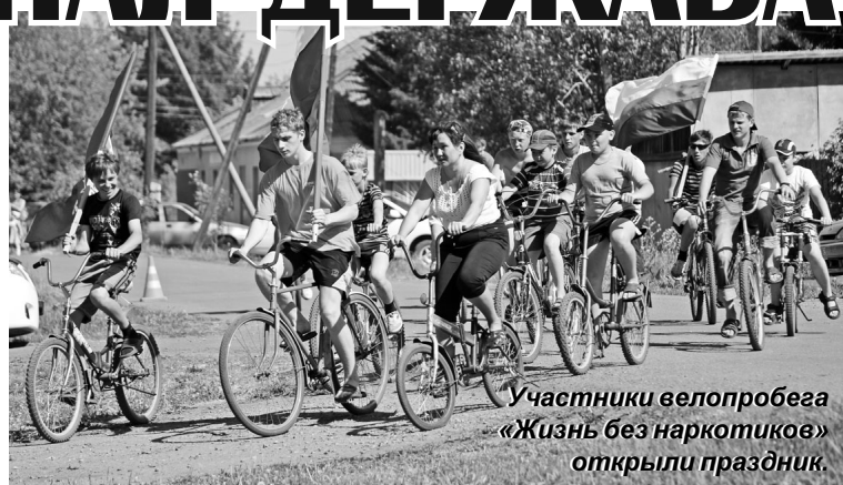
Участники велопробега «Жизнь без наркотиков» открыли праздник.

Самым волнующим событием этого дня стала церемония вручения премии главы района молодым талантам, прошедшим серьезный конкурсный отбор по пяти номинациям: за успехи в учебной, профессиональной, спортивной и общественной деятельности, а также в области культуры и искусства.