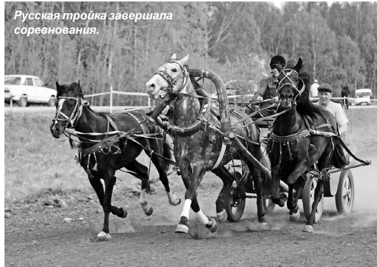
Русская тройка завершила соревнования.