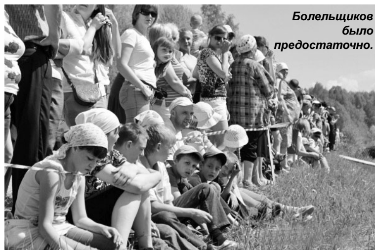
Болельщиков было предостаточно.