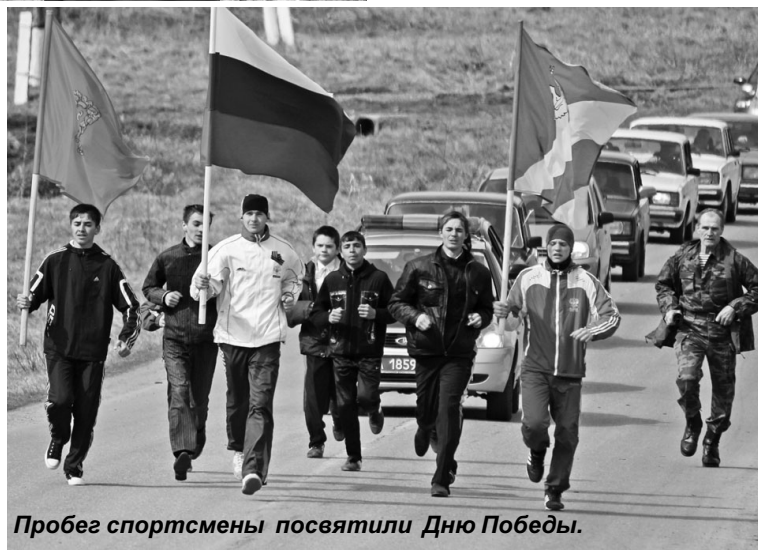
Пробег спортсмены посвятили Дню Победы.