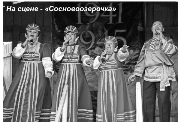
На сцене - «Сосновоозерочка»