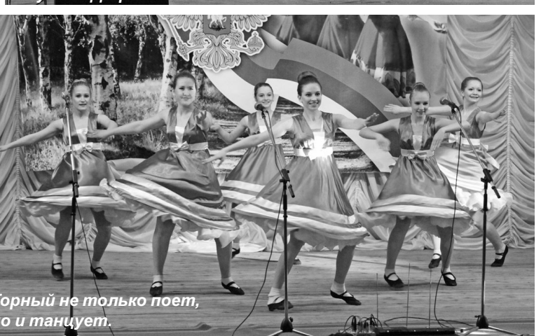
Горный не только поет, но и танцует.