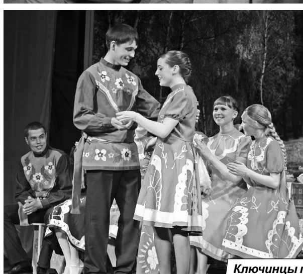
Ключинцы пригласили отпраздновать вместе Красную горку – старинный праздник.