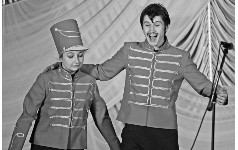
Театральная студия «Экспромт» покорила зрителей.