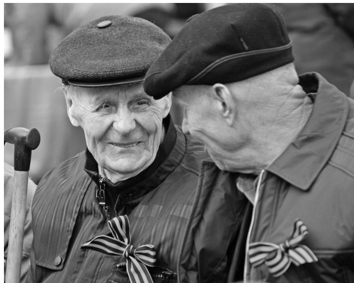
Им есть что вспомнить, им есть, о чем печалиться, чему радоваться.