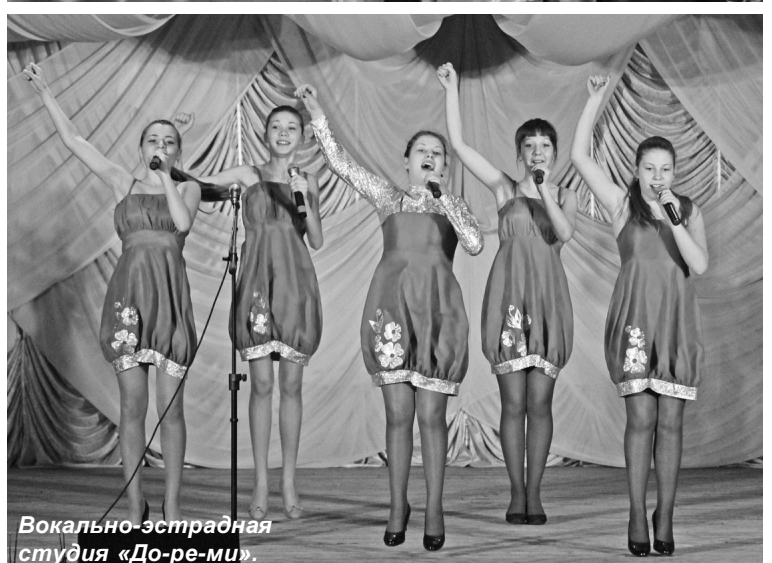
Вокально-эстрадная студия «До-ре-ми».