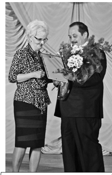
Лучшим вручались награды.