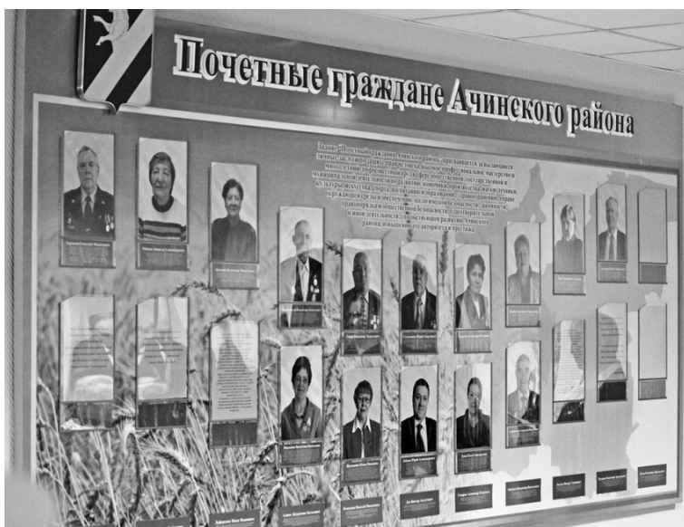
Достойных, заслуженных людей нужно знать в лицо.