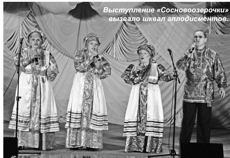
Выступление «Сосновоозерочки» вызвало шквал аплодисментов.