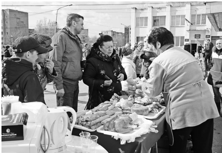
Страницу подготовили Ирина КИРИЛЛОВА (текст) и Людмила ПЕТРОВСКАЯ (фото).