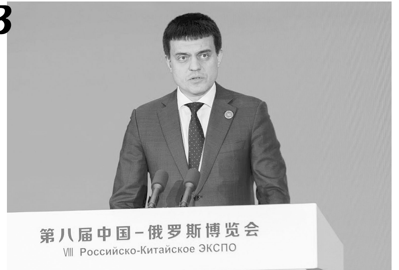
第八届中国-俄罗斯博览会 VIII Российско-Китайское ЭКСПО