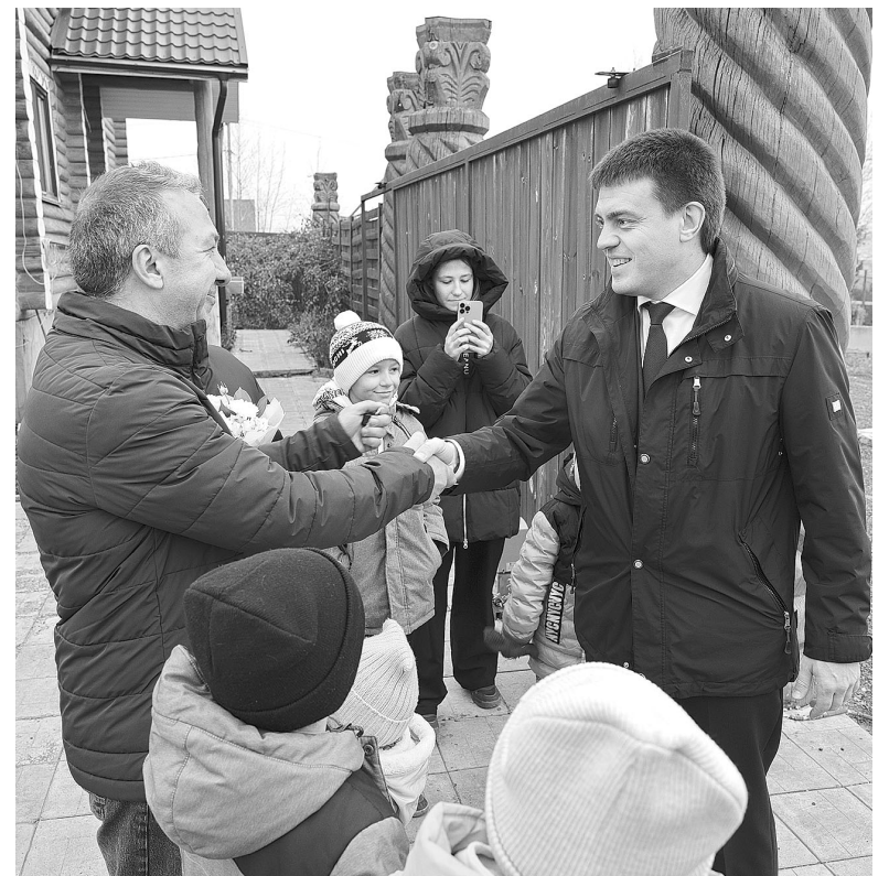
Михаил Котюков живо откликнулся на просьбу многодетной семьи.

— Когда дети машину в окно увидели, весь дом переполошился. Бежали, смотрели, какая она, какого цвета. Без ав-