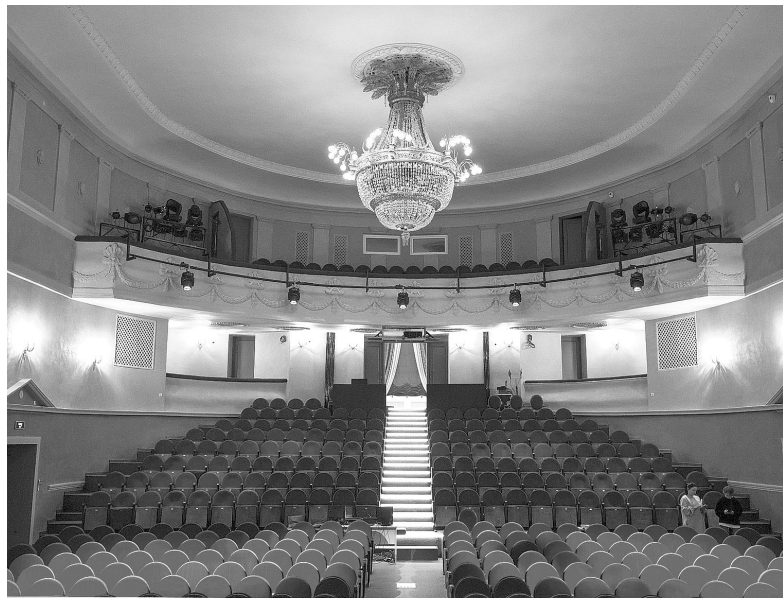
Обновленный ТЮЗ уже ждет зрителей