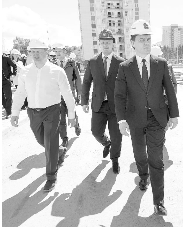
В течение года губернатор лично контролировал ход строительства домов для дольщиков, пострадавших от действий недобросовестных компаний

– Социальные сети – одна из немногих форм, где можно на-