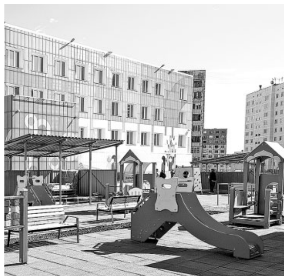
С началом работы нового корпуса детского сада в Норильске закрыт вопрос с нехваткой мест для дошкольников