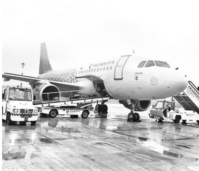
В красноярском аэропорту завершился первый этап реконструкции перрона воздушных судов

Пожалуй, человеку, неискушенному в финансовых тонкостях, сухие цифры мало что скажут. Но достаточно понимать: за ними – вся наша жизнь с ее заботами, расходами, текущими планами. Эти деньги – фундамент, на котором базируется уверенность каждого жителя края в завтрашнем дне. Бюджет – это зарплаты врачей и учителей, благоустройство городов и сел, новые дороги, социальные выплаты и пособия, развитие здравоохранения. Не случайно Михаил Котюков недавно отметил, что дополнительные средства нужно учесть в осенней корректировке бюджета и профинансировать самые важные направления. В том числе выполнение майских указов президента и национальных проектов, обеспечение жильем детей-сирот, компенсацию населению оплаты услуг ЖКХ. Основная часть средств пойдет на увеличение фондов оплаты труда работников бюджетной сферы. Кроме того, вырастет финансирование льготного лекарственного