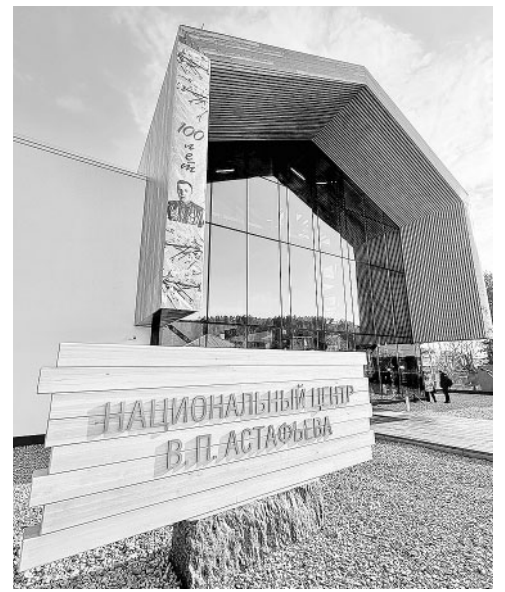
Обновление села Овсянка и строительство Национального центра В. П. Астафьева проходили под личным контролем губернатора

обеспечения, будут предусмотрены средства на увеличение бюджетных мест в колледжах и техникумах, развитие студенческого спорта, новые молодежные проекты и помощь муниципалитетам в решении вопросов, о которых говорят жители на встречах в районах.