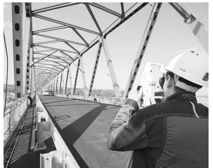
Открытый в 2023 году самый северный мост через Енисей – Высокогорский – позволил установить круглогодичную транспортную связь с северными районами края