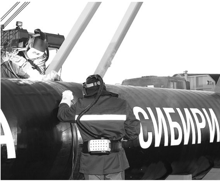
Газификация решит острую экологическую проблему как в Красноярске, так и в других крупных городах региона